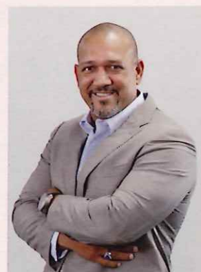
アレックス・ラミレス