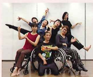
インテグレイテッド・ダンス・カンパニー響・Kyo