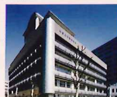
東京都立文京盲学校